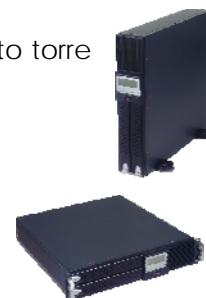
JP Pro XL 3000